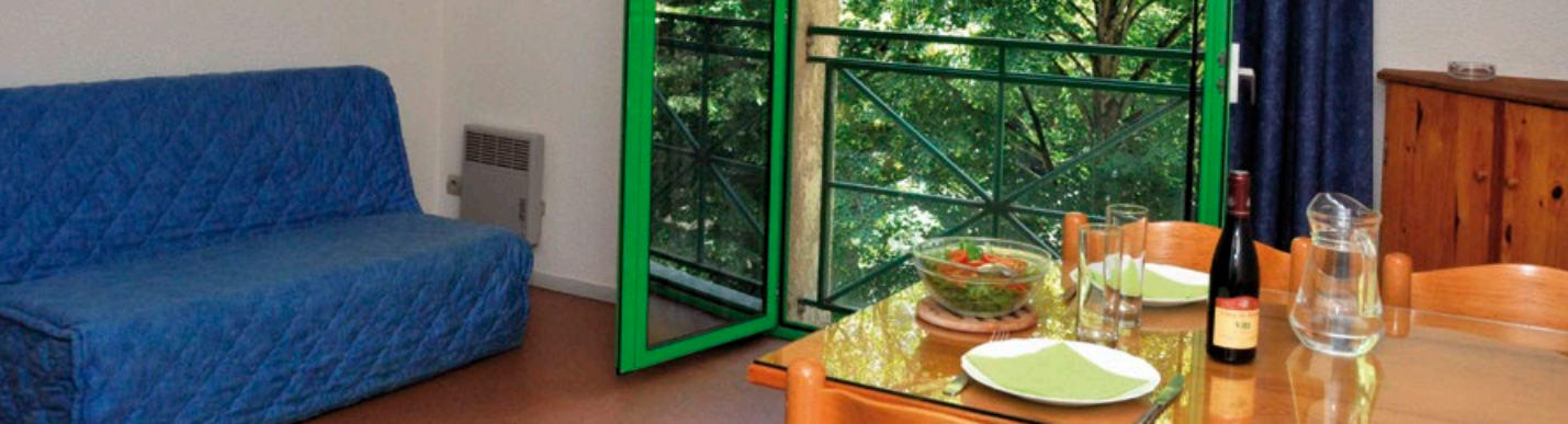
La Résidence Napoléon