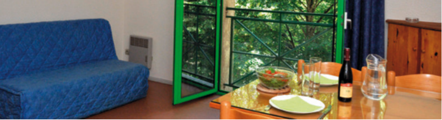
La Résidence Napoléon