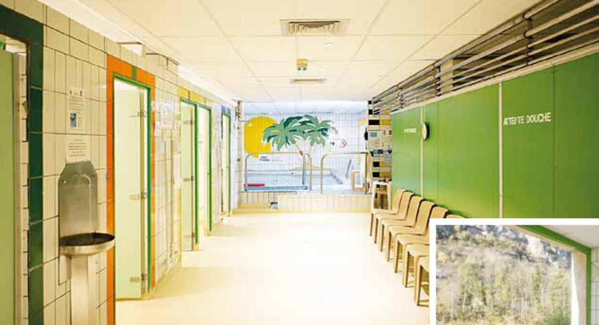
Thermes du Parc