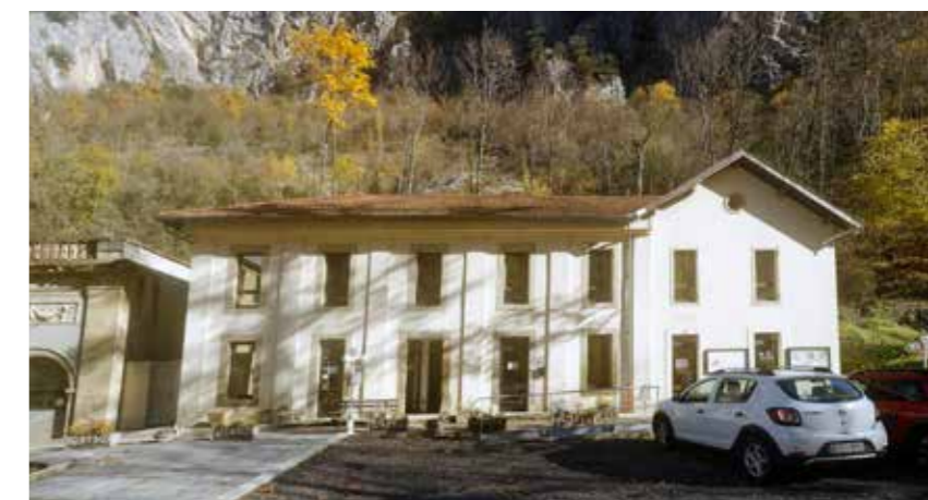
Meublés des Thermes

Les meublés des Thermes sont situés au 1 er étage sans ascenseur. ●