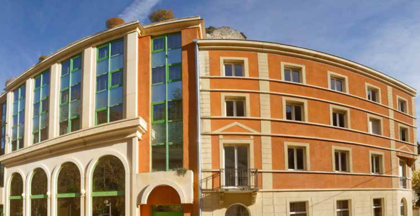
Résidence du Parc